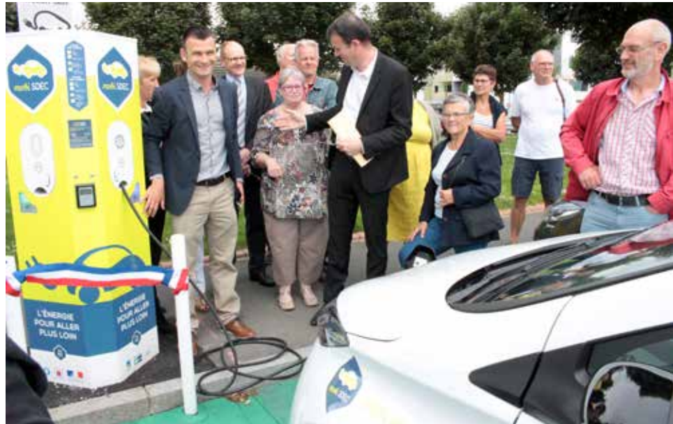
Inauguration de la borne de recharge place François-Mitterrand.

La première a été inaugurée le 29 mai dernier sur la place François-Mitterrand. Deux autres bornes MobiSDEC ont aussi été installées dans la commune.