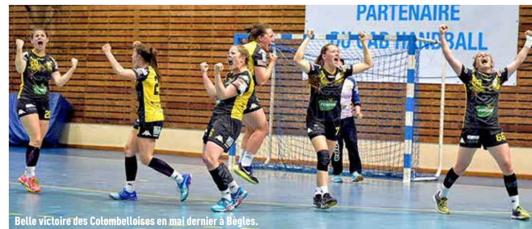
Belle victoire des Colombelloises en mai dernier à Bègles.

Le CL Colombelles Handball compte cette année 203 licenciés, quatorze équipes engagées en compétition avec son équipe phare féminine qui évolue depuis plus de 13 ans en Nationale 1 (3 e niveau national).