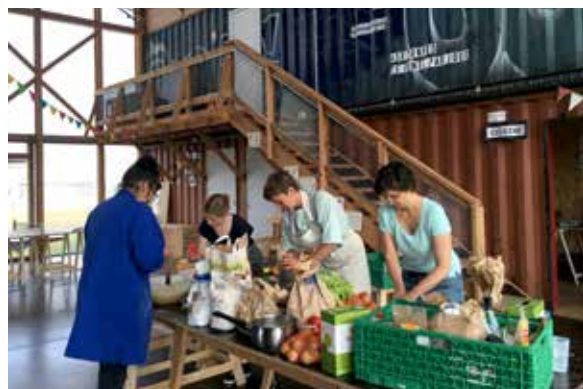
À l'intérieur de la Cité de Chantier.

L'odeur de cuisine est alléchante. Comme tous les deuxième vendredi du mois, le déjeuner se prépare collectivement. Il suffit de s'inscrire (1) pour un prix symbolique et la table s'offre à vous. « Progressivement, le bouche-à-oreille fonctionne et de plus en plus de personnes