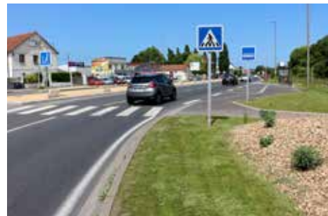
Le carrefour Lazzaro avec ses nouveaux aménagements.

Après d'importants travaux pour le sécuriser - création de cheminements piétonniers, déplacement de l'arrêt de bus, places de stationnement, etc. (Lire Colombelles nouvelles #29) - menés par le Conseil départemental et complétés par des aménagements paysagers de la Ville, le carrefour Lazzaro finit de changer de visage. Une aire de covoiturage de 59 places est venue compléter les changements. Enfin, le château d'eau situé rue Francis de Préssencé a aussi été rasé au début de l'année. L'ouvrage de 35 m de haut était devenu obsolète avec la mise en place d'un nouveau réservoir d'alimentation en eau potable.