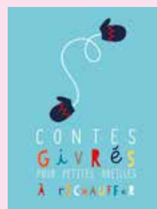
Cie En faim de cOntes