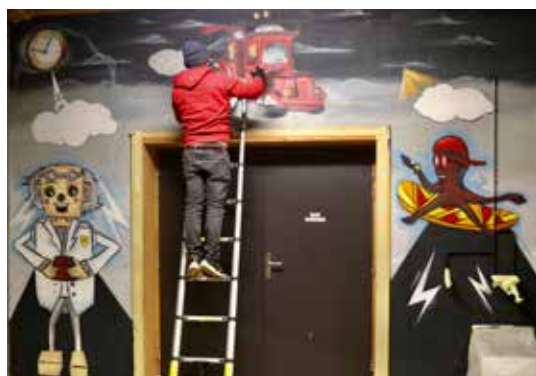
Graff par Blesea