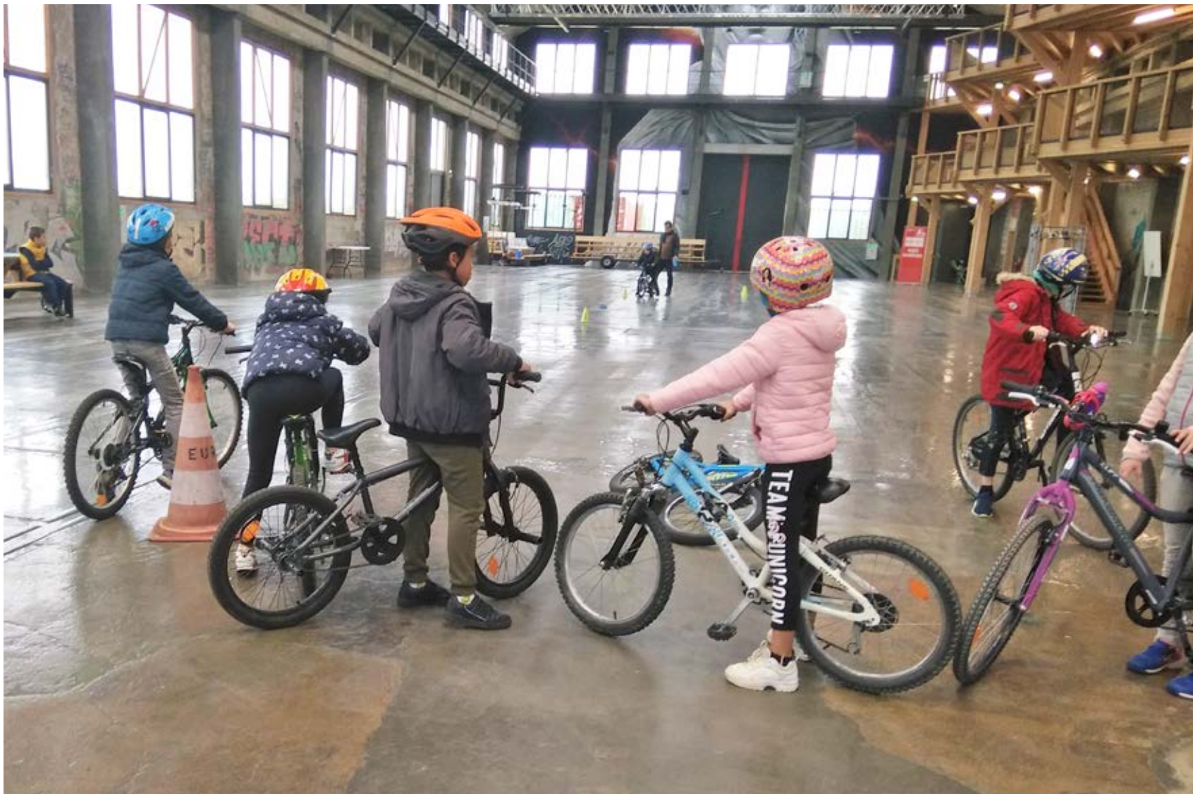
Session vélo-école à la Grande Halle, lors des vacances de la Toussaint.