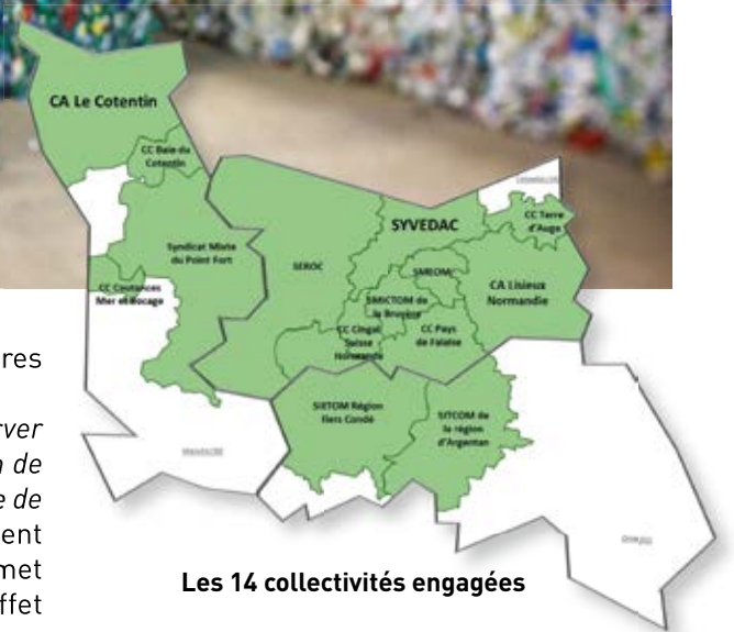
Les 14 collectivités engagées

En termes de transport, il devra aussi intégrer dans les flux existants, et à venir, le trafic routier généré ; éviter le trafic sur la D226, notamment la traversée de Cuverville, et étudier des solutions de transport alternatives (ferroviaire, fluviale). Dans l'objectif de réduire les transports, les collectivités utiliseront un