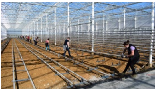
Installation du système de chauffage.

La chaleur, nécessaire à la culture des tomates, poivrons et aubergines, est issue de l'incinération des déchets de l'usine du Syvedac. Un réseau de chaleur souterrain de 700 mètres a été créé entre l'usine et les serres maraîchères. Des tuyaux soudés, posés à quelques centimètres du sol et d'autres en hauteur maintiennent une température moyenne de 19°. Les déchets sont ainsi réutilisés, source d'une nouvelle énergie verte. L'eau est, quant à elle, gérée avec des boîtiers connectés qui indiquent informatiquement le taux d'humidité pour réguler l'arrosage au sol et en goutte à goutte. Le système hydraulique