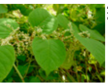
Renouée du Japon