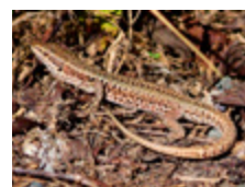
Lézard des murailles